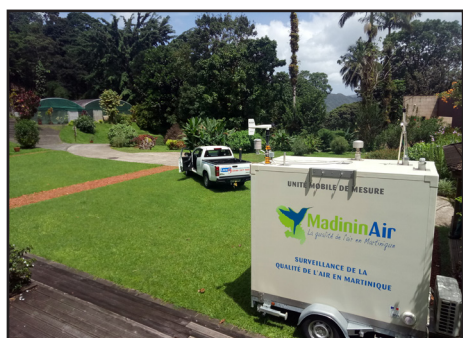
Localisation du moyen mobile dans la commune du Morne-Rouge